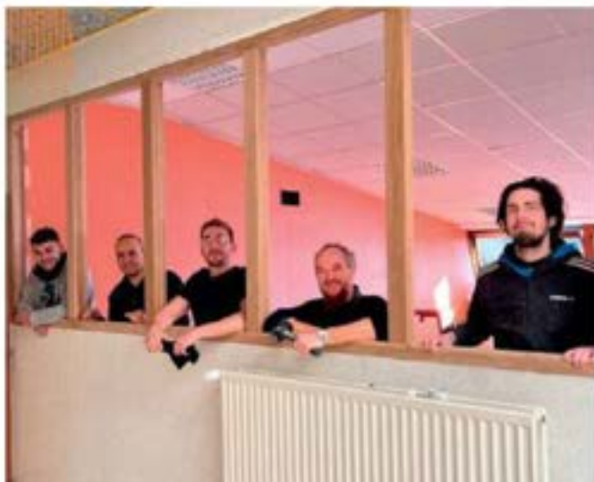
Aménagement de l'espace numérique par les apprentis compagnons du Centre de formation de la Fédération Compagnonnaïque du Loiret