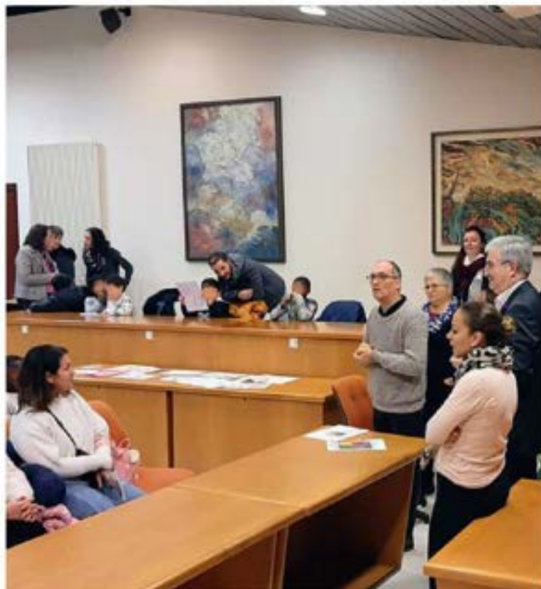
Signature de la convention de partenariat avec la Fondation d'Orléans à la mairie de St-Jean de Braye en présence de parents accompagnés de leurs enfants (12/11/22)