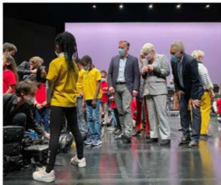
Remise des instruments de musique aux enfants des quartiers prioritaires (projet DEMOS, création d'un orchestre symphonique 28/2/2022