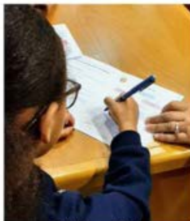
Club Coup de Pouce