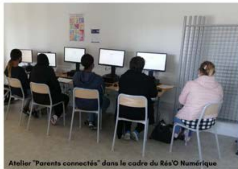
Atelier "Parents connectés" dans le cadre du Rés'O Numérique

L'illectronisme ou l'exclusion numérique concerne 20 % de la population à des degrés divers. Cette exclusion est souvent un mal qui s'ajoute à d'autres formes d'exclusion. Nombreux sont ceux qui manquent de compétences pour effectuer les démarches de base à l'ère du numérique, entrer en contact avec les services publics, faire valoir ses droits, chercher un emploi, télétravailler ou aider ses enfants pour les devoirs à la maison.