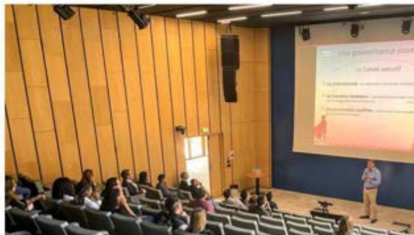
Journée des partenaires de Thémis Assurances