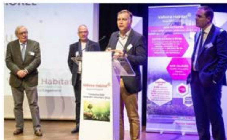
Signature de la convention de mécénat lors de la première convention RSE de VALLOIRE HABITAT. 2/12/22